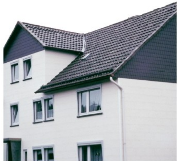
ZF ZIERER®-Bogenschnitt, Putz weiß