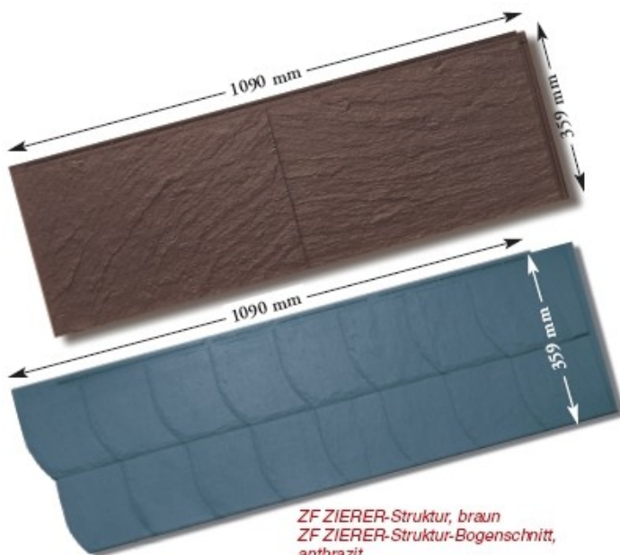
ZF ZIERER®-Struktur, braun ZF ZIERER®-Struktur-Bogenschnitt, anthrazit