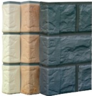
ZF ZIERER-Original-Ecke Bruchstein