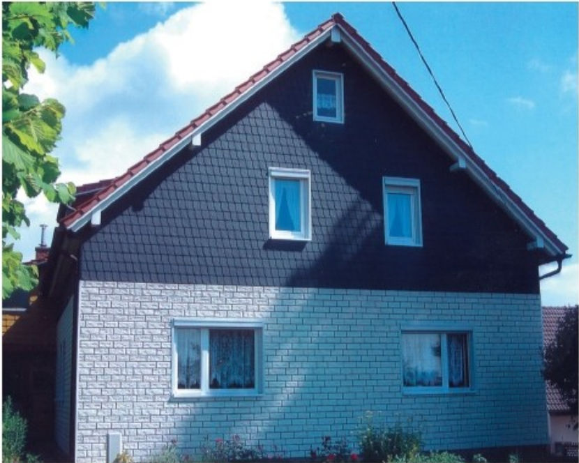
ZF ZIERER-Bruchsteinstruktur, weiß

Die Bruchsteinstruktur lockert Fassaden im Sockelbereich auf, hat aber auch eine harmonische Wirkung in großen Flächen.